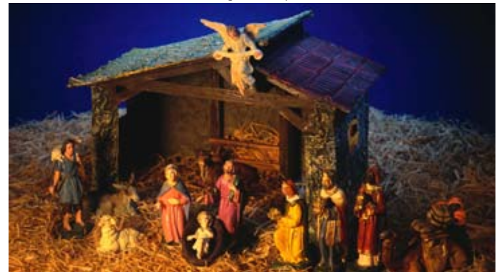
Frehe Weihnachten und ein gutes, erfolgreiches, vor allem aber gesundes neues Jahr wünscht der Ochsenfurter FV allen seinen Mitgliedern, Freunden und Fans.