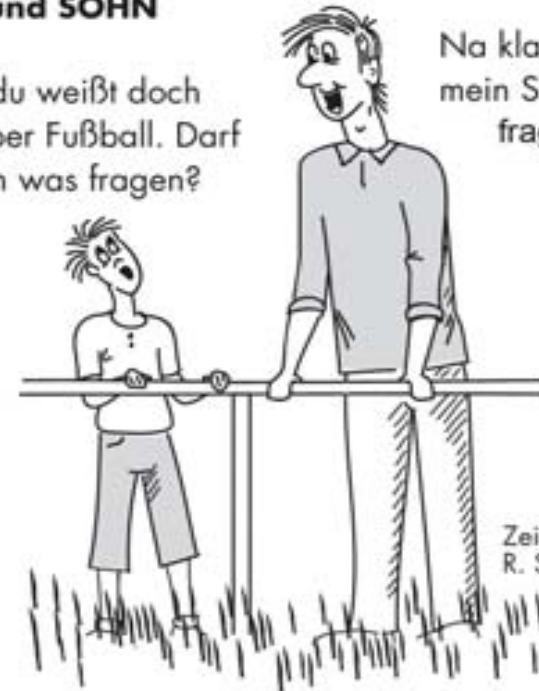
Zeichnung: R. Stryjski