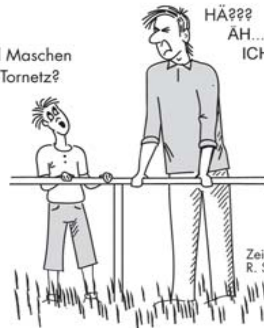
Zeichnung: R. Stryjski