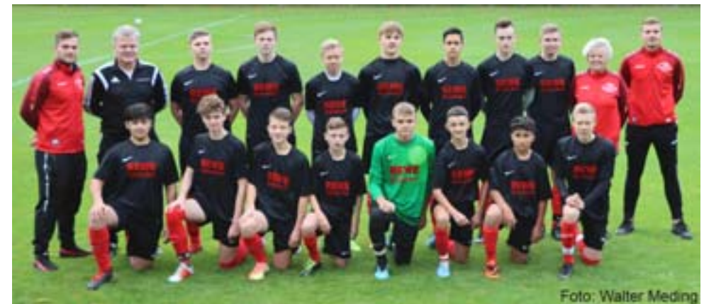
Das U17-Meisterteam der JFG Maindreieck-Süd der abgelaufenen Saison.