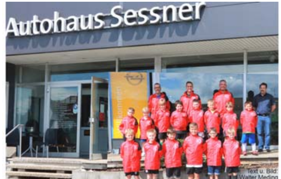
Text u. Bild: Walter Meding