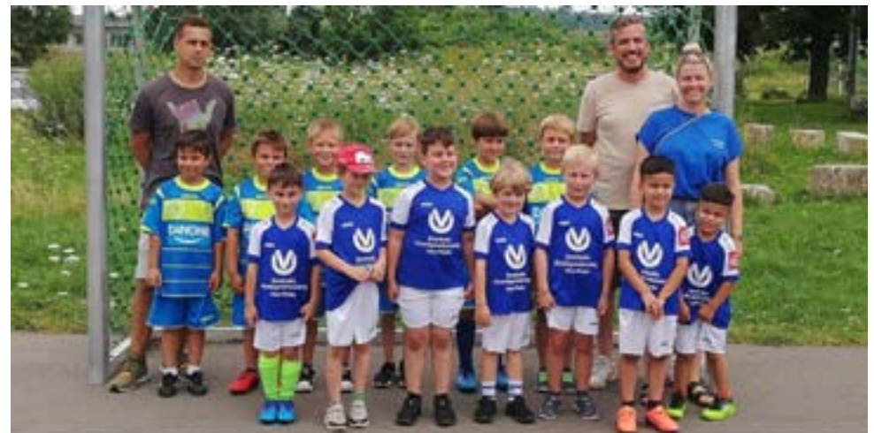
Präsentieren sich den Zuschauern in Goßmannsdorf: Die Kids der U7 unserer SG mit dem TSV Goßmannsdorf