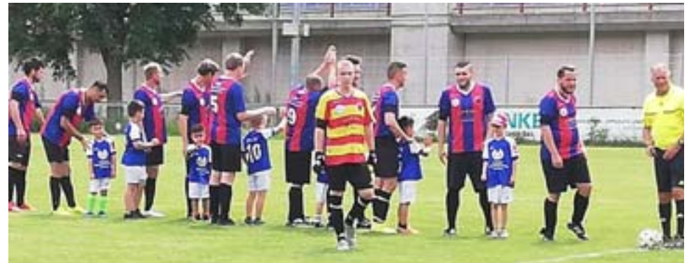
Wie im Fernsehen – Unsere Kleinen, im doppeldeutigen Sinn, ganz groß!